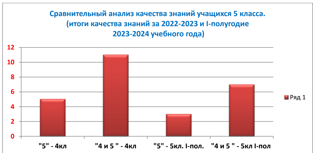
Диаграмма показывает, что уровень качества обученности в 5 классе повысился в сравнении с 4 классом.

Работа в рамках ФГОС в 5-9 классах. Федеральный государственный образовательный стандарт основного общего образования ФГОС ООО, утвержден приказом Министерства просвещения РФ от 31 мая 2021 г. № 287 “Об утверждении федерального государственного образовательного стандарта основного общего образования”.