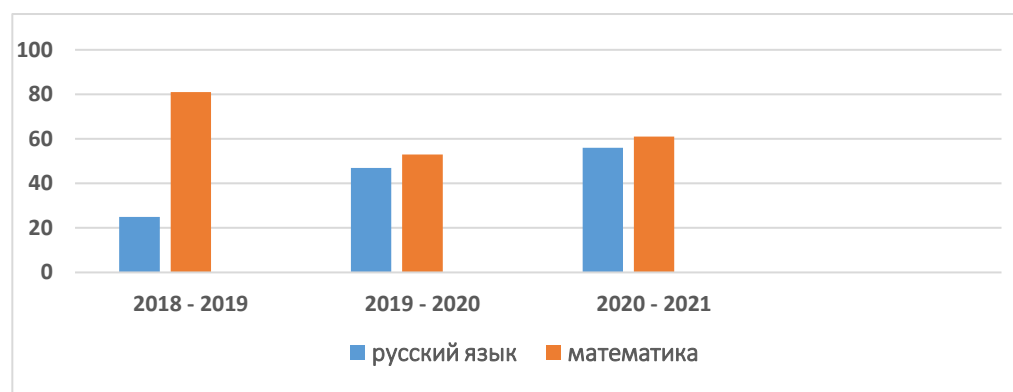
Диаграмма демонстрирует динамику показателей качества знаний ОГЭ за три года.

За последние три года все выпускники 9 классов МКОУ «Экибулакская ООШ» прошли государственную итоговую аттестацию по программам основного общего образования и все получили аттестаты об основном общем образовании.